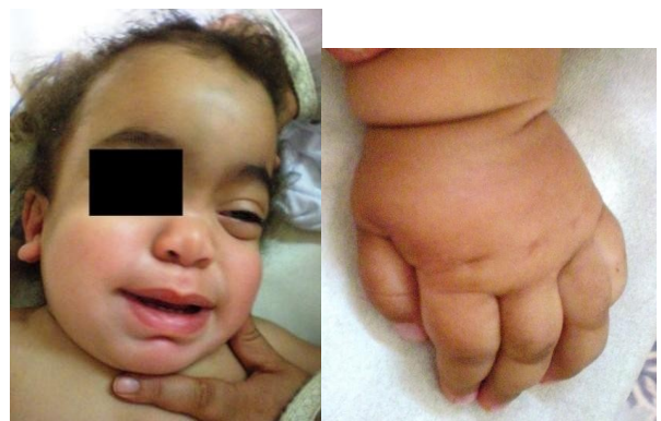
Figure 2 : Maladie de Hurler { l'âge de 3 ans, patiente décédée { l'âge de 6 ans par insuffisance cardiorespiratoire, noter le faciès grossier et la main en griffe présents chez la plupart des patients atteints de MPS.

Enfin la maladie de Scheie est caractérisée par une espérance de vie beaucoup plus longue et une atteinte somatique très modérée.